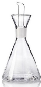
Aceitera antigoteo cristal 500ml GLM.6305 Unidades de Caja: 6 PVP recomendado: 24,95€