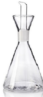
Aceitera antigoteo cristal 1000ml GLM.6309 Unidades de Caja: 6 PVP recomendado: 29,95€