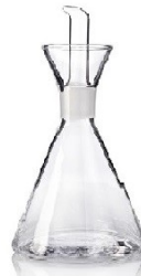
Aceitera antigoteo cristal 200ml GLM.6302 Unidades de Caja: 6 PVP recomendado: 15,95€